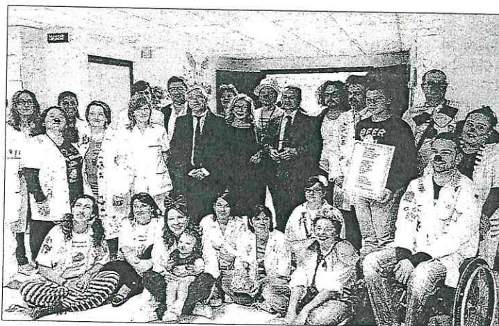
Ospedale L'inaugurazione della nuova sala d'aspetto del reparto di pediatria

► FOLIGNO - Un ospedale, così come qualsiasi altro luogo di cura, deve essere accogliente e a misura d'uomo, tanto più quando il paziente è un bambino. E da questo punto di vista il reparto di pediatria del San Giovanni Battista di Foligno è esempio d'eccellenza. Una dimensione, un approccio all'accoglienza, ancor più apprezzabile grazie alla nuova sala d'aspetto, inaugurata ieri mattina, nella quale i bambini che, accompagnati dalle loro famiglie, entrano nel reparto in attesa di visite e cure, hanno la possibilità di passare qualche momento di svago e di gioco. Un locale attrezzato e realizzato con il contributo e la collaborazione di: Grifo Latte, Associazione Oasi (che cura il servizio dei clown di corsia), Duo Design, Forno Santa Rita, Job Solutions, Isola Cooperativa Sociale, Domus, Dea Illuminazio-